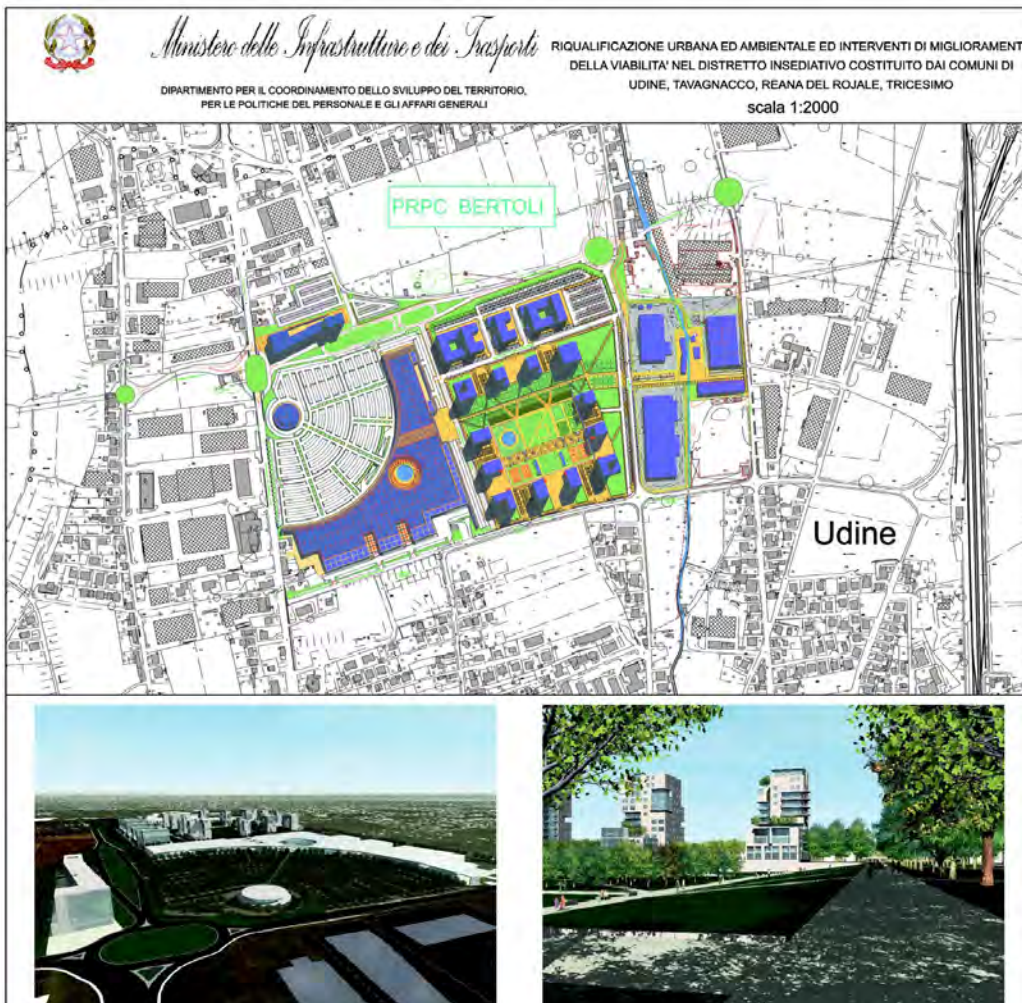
Stato di fatto dell'area e planivolumetrico della proposta di riqualificazione.

Si tratta di interventi che prevedono una riorganizzazione e riqualificazione ambientale degli ambiti urbani che hanno avuto storicamente una destinazione d'uso orientata alla localizzazione di attività industriali e che oggi vedono esaurita questa funzione; e, in secondo luogo, si tratta di azioni volte a rigenerare centri abitati caratterizzati dalla promiscuità delle funzioni residenziali e produttive, giunta ormai ad un limite e non più sostenibile.