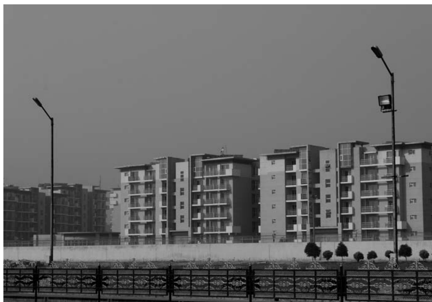
Immagine 6-7. Villaggio per gli atleti, Commonwealth Games 2010