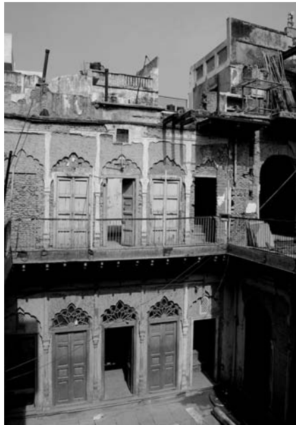
Immagine 2. Shajhanabad: interno della corte di un'haveli

governativa di controllo con il compito di gestire l'organizzazione degli spazi pubblici nonché la progettazione delle abitazioni popolari.