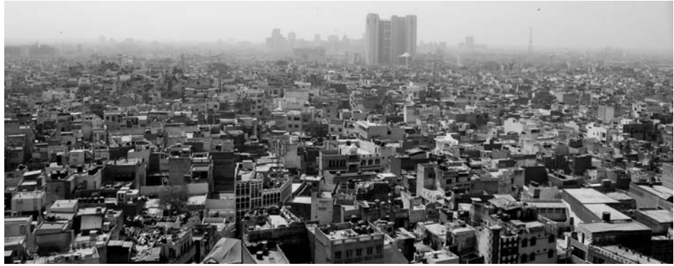
Immagine 1. Vista della città di Delhi

Si dice spesso che Delhi sia una città sorta dal nulla, una grande metropoli senza passato e con un futuro incerto, senza una sua precisa identità storica ed unitaria che la caratterizzi. Territorio antichissimo, abitato fin dai tempi medioevali del sultanato, già luogo di sette antiche città moghul, crocevia di commercianti e flussi di migranti, Delhi ha acquistato il ruolo di capitale soltanto all'inizio del XX secolo quando, per motivazioni politiche, la capitale indiana è stata spostata da Calcutta.