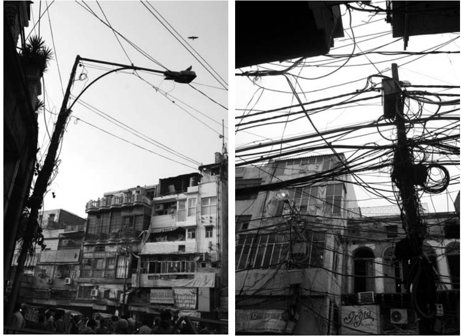
Immagine 4-5. Shajhanhabad: pattern compositivo della città storica

Nella normativa vigente ogni piano ha una durata effettiva ventennale allo scadere del quale periodo il piano in corso viene ri-editato, ovvero corretto e modificato secondo gli errori e le necessità emerse nell'arco di tempo di validità del piano precedente. La seconda versione del primo piano (MP2001) è entrata in vigore soltanto negli anni Novanta. La versione denominata Delhi Master Plan 2021, è invece entrata in vigore nel 2001 ed è tuttora in atto e potenzialmente valida sino al 2021. I precedenti Master Plan del 1962 e del 2001 si basavano su un modello fluido e organico, dove la semplicità dei movimenti e la facilità dei trasporti avrebbero dovuto essere gli elementi più significativi.