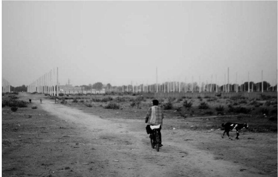
Immagine 9. Spazio liscio nella colonia di reinsediamento