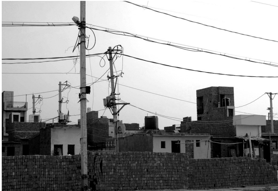
Immagine 10. Colonia di reinsediamento

Tutte le immagini sono state scattate da Claudia Roselli in un arco di tempo tra il 2009 e il 2012.