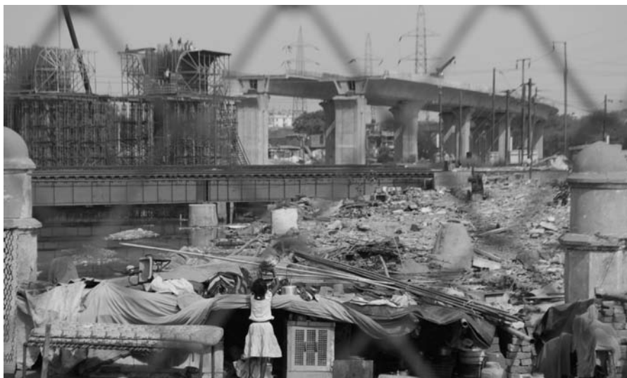
Immagine 8. Lavori in corso pre-Commonwealth Games, Ottobre 2010

Vorrei che non ci fosse un controllo capitalistico della gestione della governance, che si ritornasse ad una concezione più socialista del welfare state. Non continuare con questo genere di economia, figlia di una crescita sempre più insostenibile. Piuttosto cambiare il corso delle tendenze contemporanee provando a pensare a case ed opportunità lavorative migliori e a servizi ed opportunità sociali per tutti gli abitanti di Delhi.