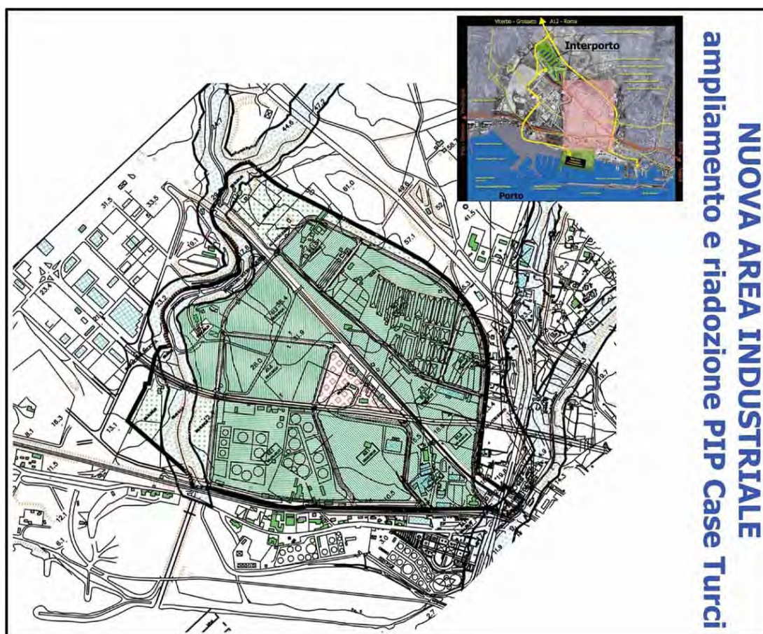
Case Turci Bianca.

Nel luglio 2003 è stata effettuata la consegna dei lavori; oggi il cantiere si presenta attivo su più fronti, dalla movimentazione materie per la realizzazione del terminal intermodale ferro-gomma, all'adeguamento del sedime per l'installazione dei magazzini gomma-gomma, alla realizzazione dell'infrastruttura viaria principale; inoltre, è stato inaugurato l'asse stradale 5 a servizio della viabilità locale ed esterna alla Piattaforma, che garantisce un accesso diretto all'area industriale e collegamenti più sicuri con la Borgata Aurelia.